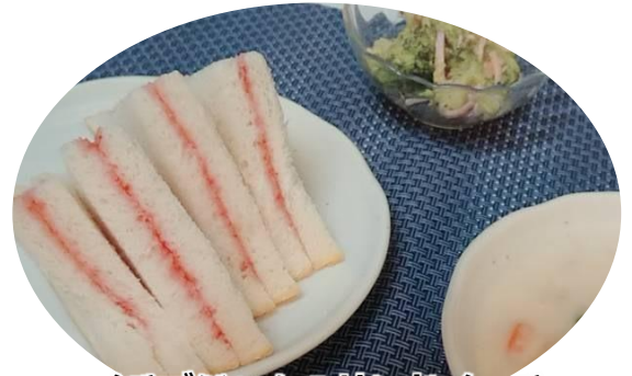
イチゴジャムのサンドイッチ